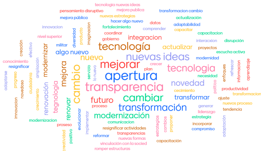
Figura 1. Significado de innovación política según trabajadores y trabajadoras de la Legislatura de Córdoba

Los trabajadores y trabajadoras reflexionaron sobre el papel que desarrollan así como también sobre las tareas y procesos que podrían modificarse para profundizar el proceso de apertura y vinculación con la comunidad.