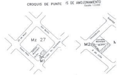
CROQUIS DE PUNTO A PUNTO DE AMOJONAMIENTO Escala 1:2.000